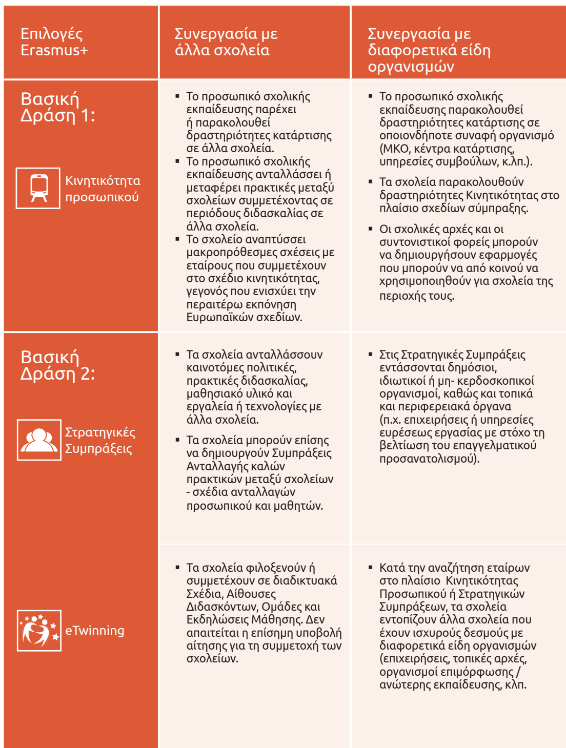
Πίνακας 1: Το Erasmus+ πλοηγός στις ευκαιρίες